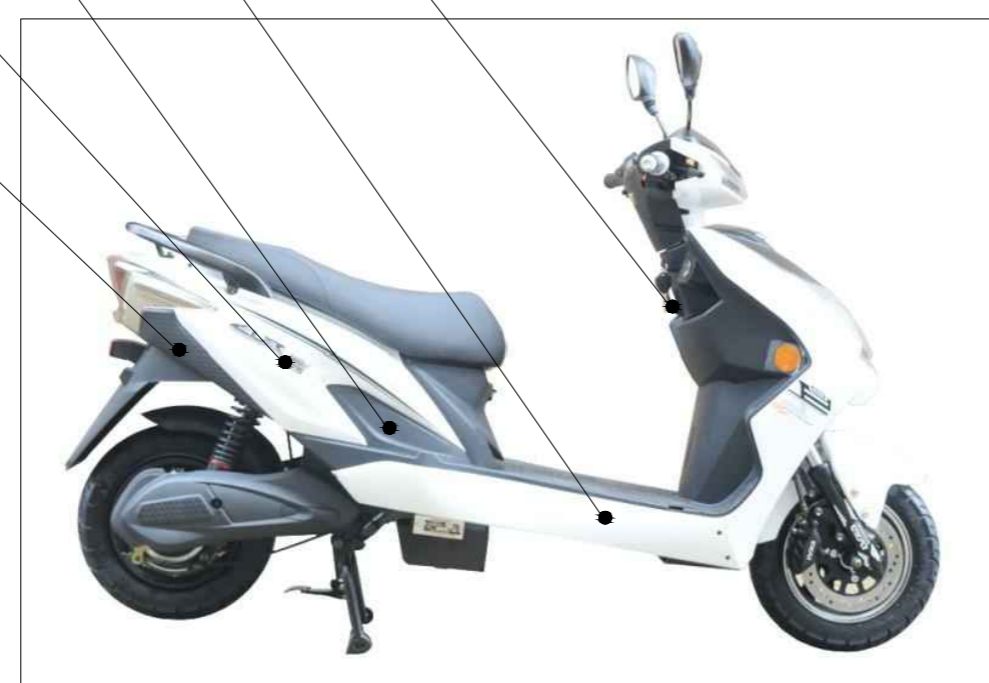
加长全能鹰五代里程版电摩 可选颜色