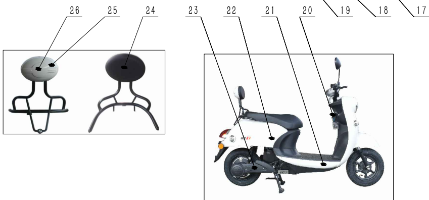
新龟王战斗版 可选颜色